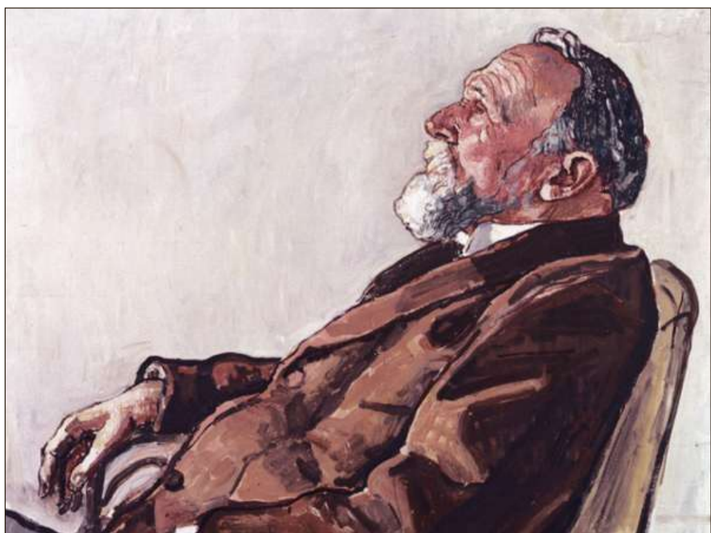
Ferdinand Hodler: Purtret da Carl Spitteler (1915).

Dapli infurmaziuns: chatta.ch/?hiid=4201 www.chatta.ch